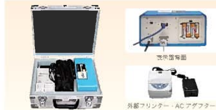
表示器・付属品 (運搬ケース収納時)