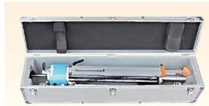
本体 (運搬ケース収納時)

社団法人日本材料学会 平成 14 年 2 月 13 日 技術評価証第 1004 号